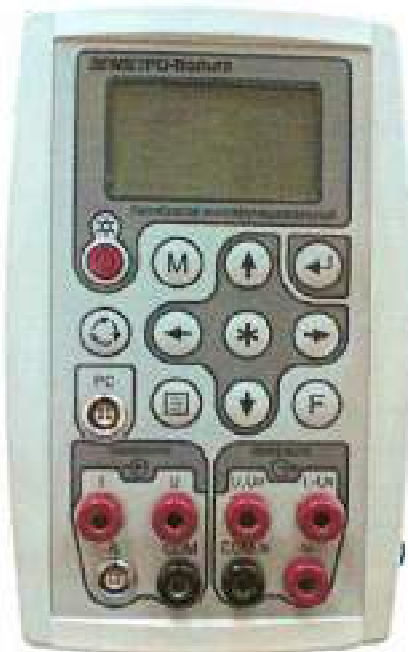
Калибратор многофункциональный ЭЛМЕТРО-Вольта