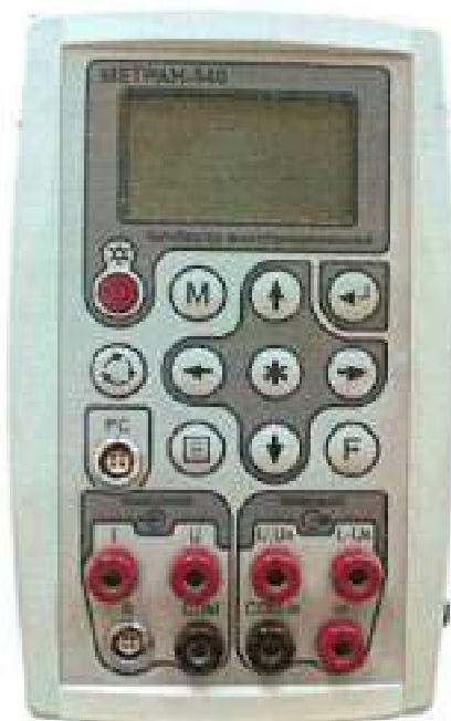
Калибратор многофункциональный Метрам-540