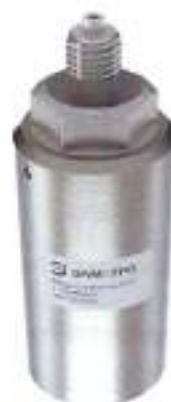
Калибратор давления портативный ЭЛМЕТРО-Паскаль-02