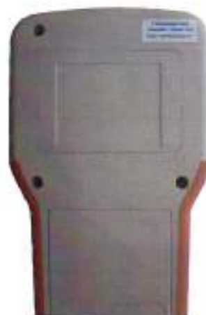
Рисунок 2 – Схема и внешний вид пломбировки калибратора от несанкционированного доступа.

Уровень защиты ПО – "С" по МИ 3286-2010.