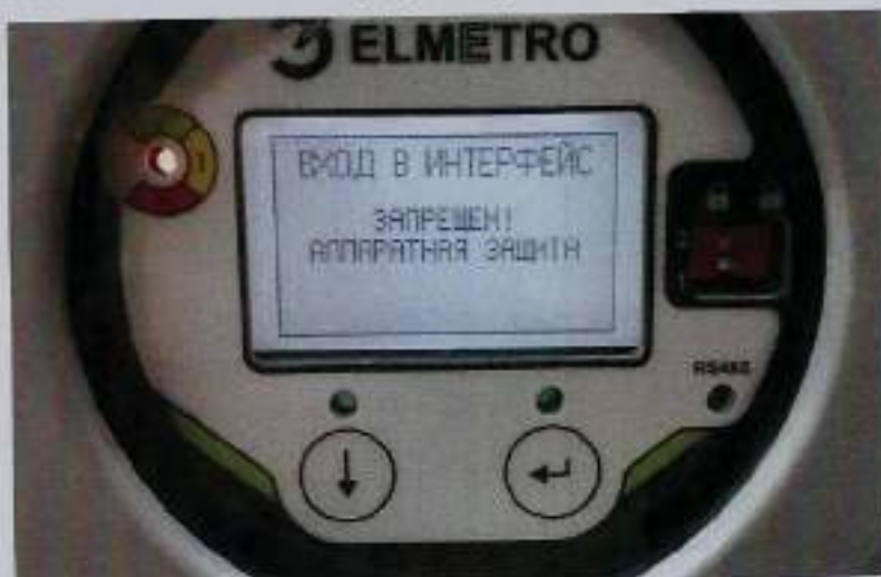
Рисунок 3 - Место пломбирования расходомера и сообщение на дисплее при запрещающем положении микропереключателей.

Защита ПО расходомера от непреднамеренных и преднамеренных изменений соответствует уровню «высокий» по Р 50.2.077-2014.