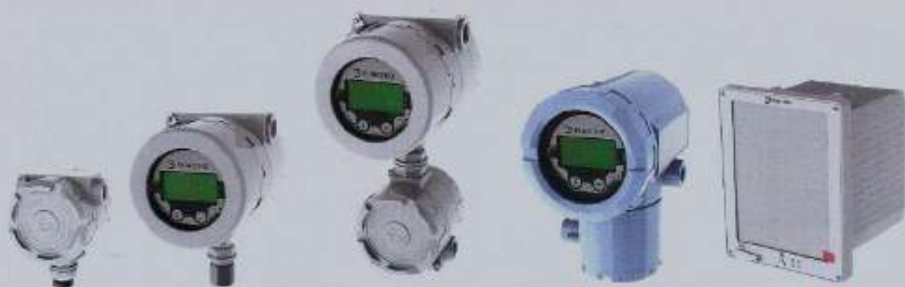
Рисунок 2 - Конструктивные исполнения модулей электронного преобразователя расходомера